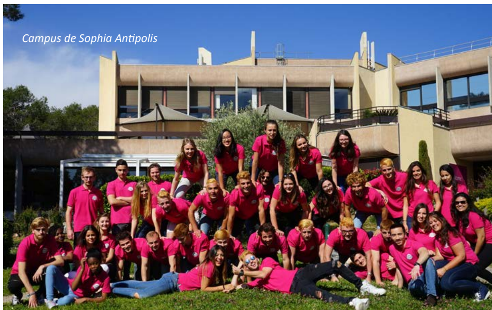
Campus de Sophia Antipolis