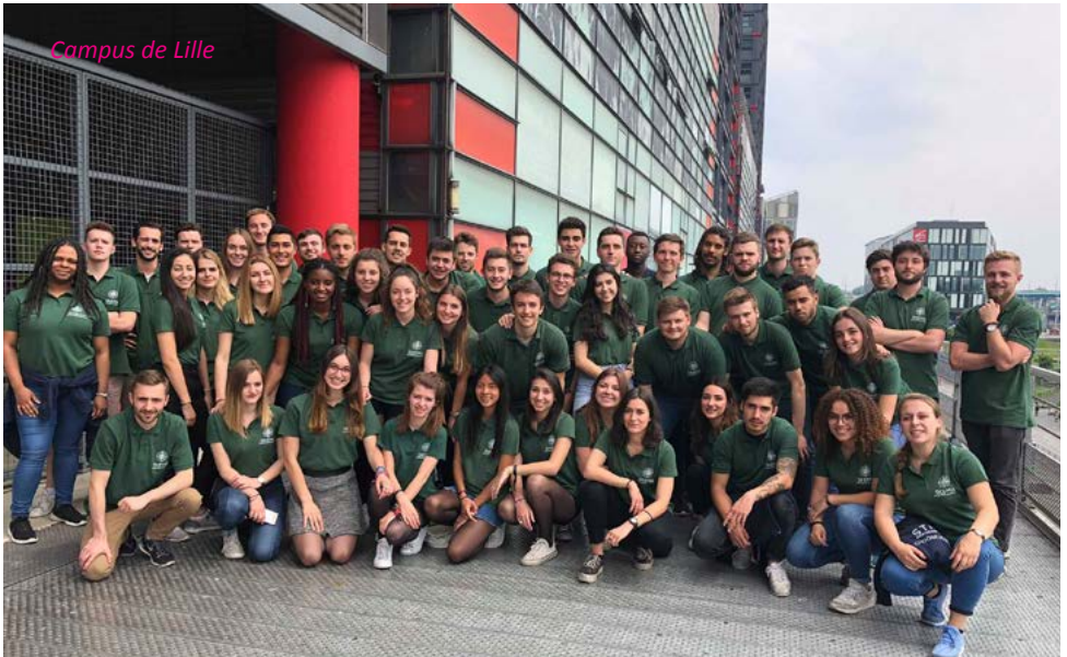
Campus de Lille