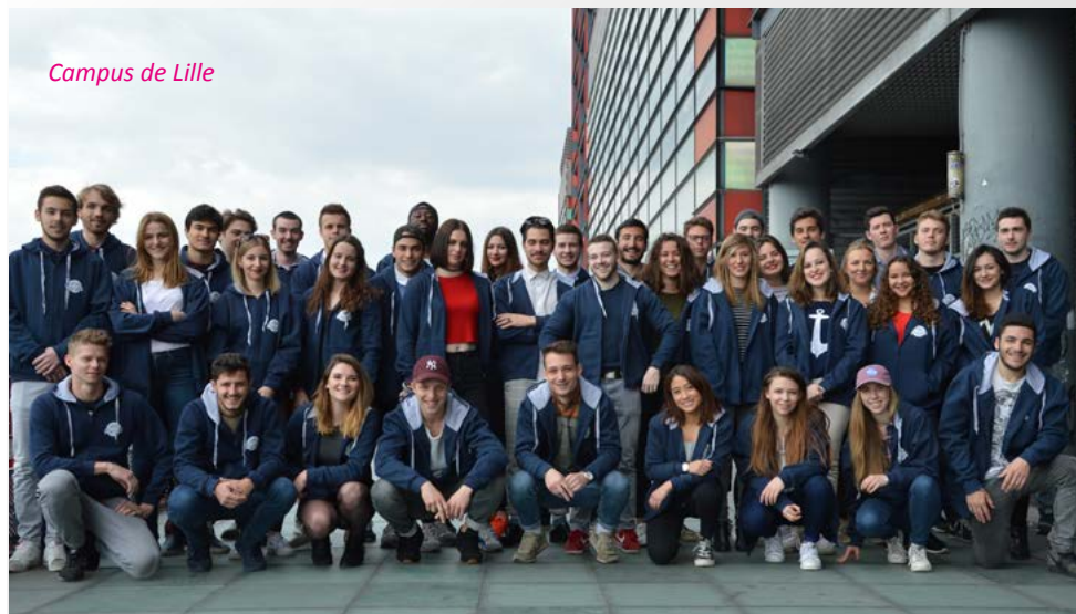
Campus de Lille