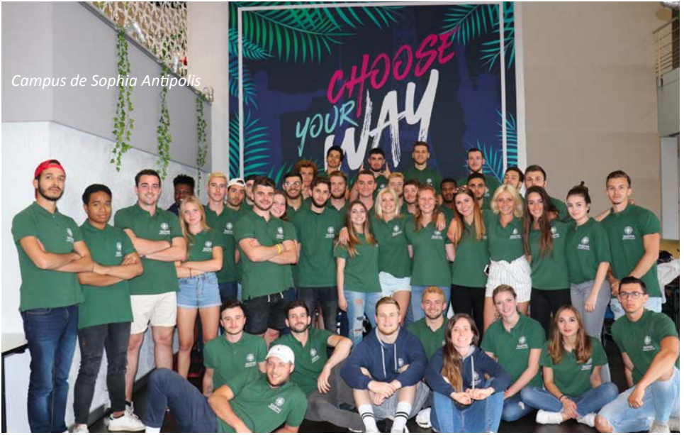
Campus de Sophia Antipolis