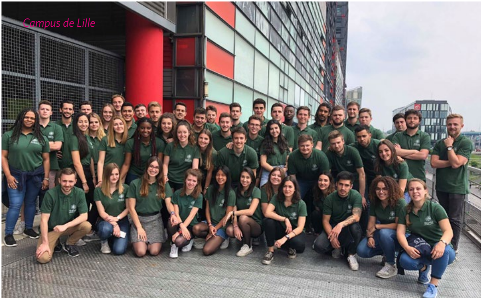
Campus de Lille