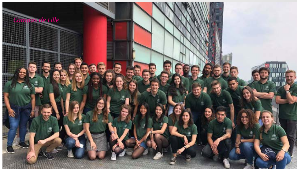
Campus de Lille