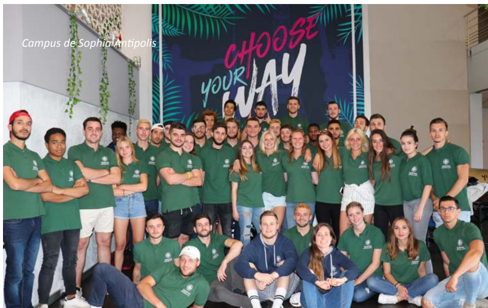
Campus de Sophia Antipolis